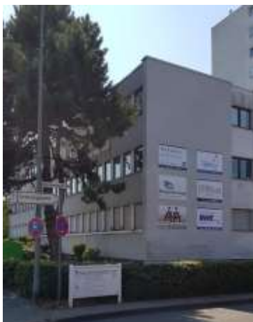
Rückseite Haus am Steinheimer Tor Hanau, Steinheimer Str. 1