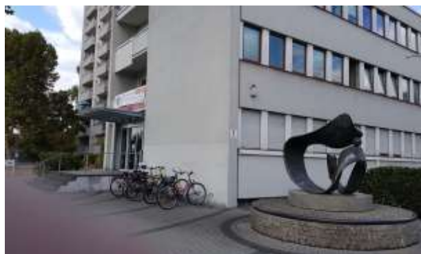
Treppe zum Haupteingang Haus am Steinheimer Tor Hanau, Steinheimer Str. 1